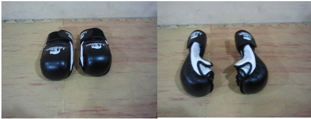
Tipología de guantillas permitidas (8 onzas).

NOTA: SE RECUERDA A LOS COMPETIDORES Y ENTRENADORES QUE LAS PROTECCIONES DE ESPINILLAS Y CABEZA DEBERÁN SER DE COLOR ROJO O AZUL AL OBJETO DE LA CORRECTA DIFERENCIACIÓN DE COMPETIDORES.